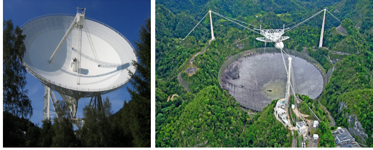
1. ábra. Balra: 100 m átmérőjű, mozgatható rádiótávcső Effelsbergben ( www.epta.eu.org ). Jobbra: 305 m átmérőjű, fix helyzetű rádiótávcső Arecibóban (Wikipedia)

(pl. a szférikus vagy kromatikus aberrációt).